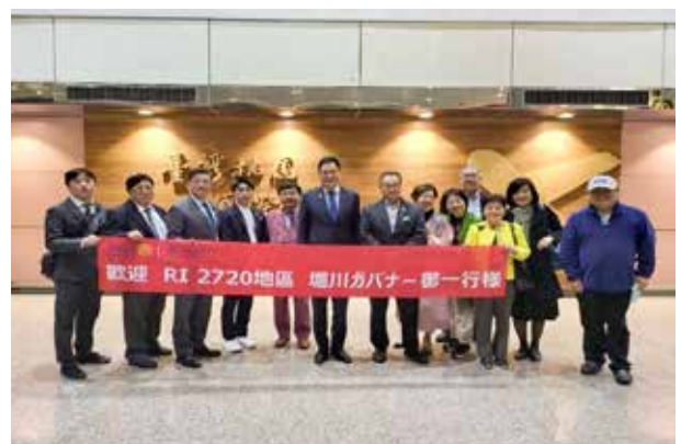
▲台湾到着直後の記念撮影

2023年1月5日(木)～7日(土)、2720地区から、6名で台湾の国際ロータリー第3523地区を訪問いたしました。今回の訪問の目的は、「①2023年4月29日の3523地区の地区大会において、私ども2720地区との姉妹地区締結に向けた、締結文書の内容の確認作業」「②台湾3523地区がホスト地区となり開催される、『第4回世界マングダリンロータリークラブ発展会議』への出席」でございました。