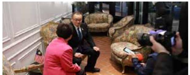
▲ 海外メディアの取材にも応じてきました

また、私ども訪問団の中には、今年度、2720地区ローターアクトの向井地区代表も同行していただき、同じく3523地区のローターアクトの地区代表、地区代表エレクトとも交流する機会となりました。今後、2720地区の若者が世界の中心で活躍する姿が、少しイマジンできた瞬間でもありました。