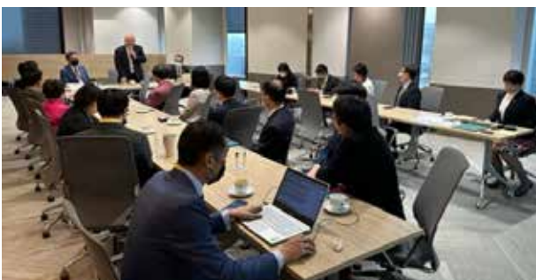
▲ 締結文書に関するミーティング風景

2日目には、台湾の教育部（日本でいうところの文部省）に出向き、日本からの訪問団と、3523地区の皆様と、台湾政府の教育副大臣らとの交流をもちました。台湾のロータリアンが政府の教育機関にも積極的に協力、提案なさっている姿勢は、日本国内ではなかなか見られない貴重な体験でした。台湾と日本の学校の交流の必要性が主な話題となっていました。その後、常在国際法律事務所という大変立派な法律事務所において、主題の一つでもありました、姉妹地区締結文書に関するミーティングを行いました。今後、それぞれの意見を反映させて、正式なものを作り上げてまいります。地区内の皆様方には、4月15日の当地区の地区大会の決議案として提出させていただきます。