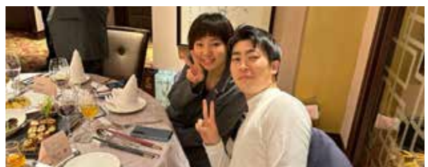
▲ ローターアクト地区代表交流