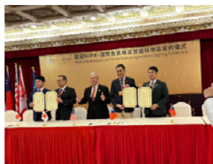
▲ 2720Japan O.K.REC