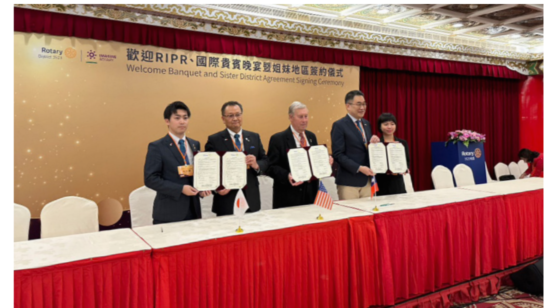
▲ 2720・3523 姉妹地区締結

2023年4月15日（土）地区大会の大会決議に基づいて、2023年4月28日（金）国際ロータリー第3523地区（台湾台北）との姉妹地区締結が滞りなく完了いたしましたのでご報告いたします。