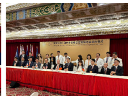
▲ 肥後大津 RC