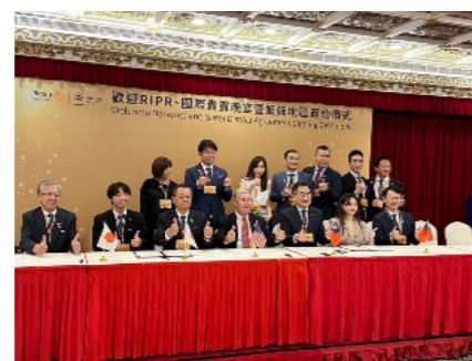
▲ 熊本りんどう RC