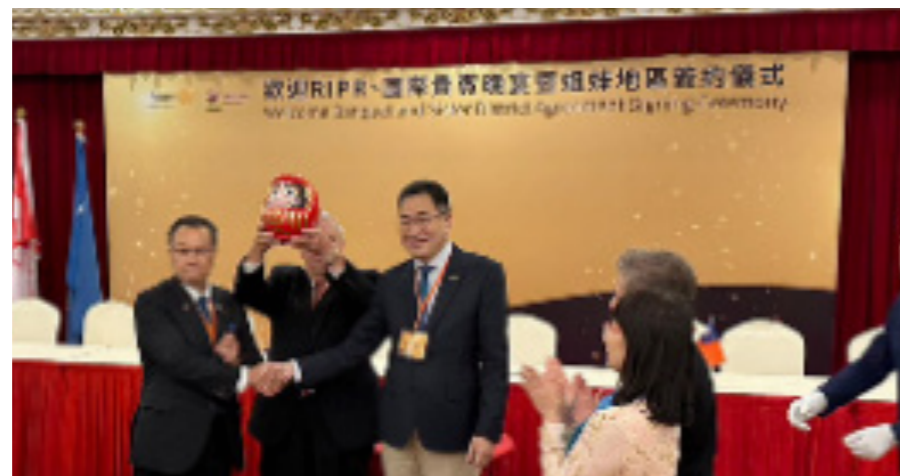
▲ 記念にダルマに目を入れました