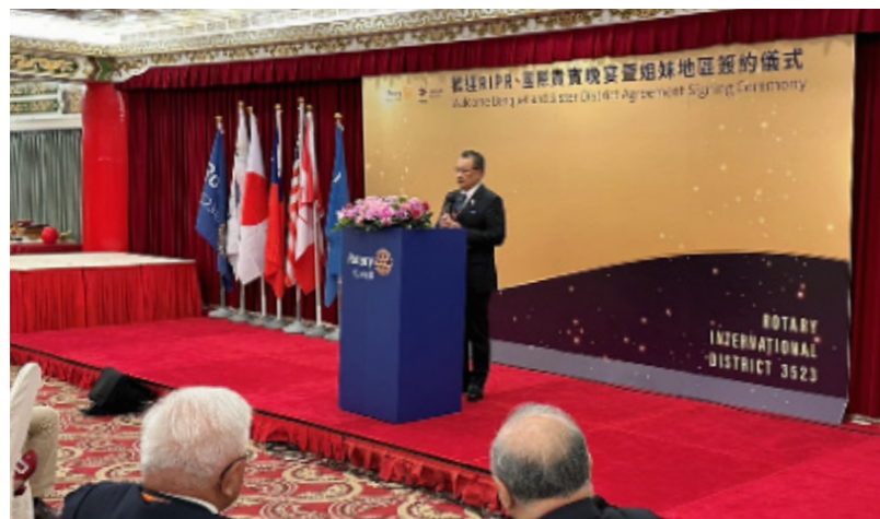
▲ ご挨拶させていただきました